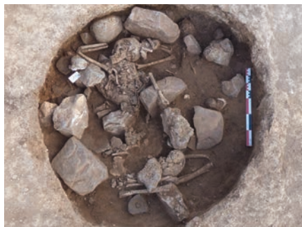
Sépulture (Bronze ancien, datation en cours) mise au jour à l'ouest de l'emprise de la campagne 2022

Cette conférence est l'occasion de présenter les vestiges archéologiques mis au jour depuis 2018 au chemin de Favayrolles à Ollioules. Dans un premier temps, elle s'attache à exposer les données sur les occupations pré et protohistoriques de ce site à la lumière des découvertes réalisées en 2022. Ensuite, elle aborde plus spécifiquement les vestiges historiques : fours à chaux, structures hydrauliques et terrasses, qui s'échelonnent de l'Antiquité aux époques moderne et contemporaine.