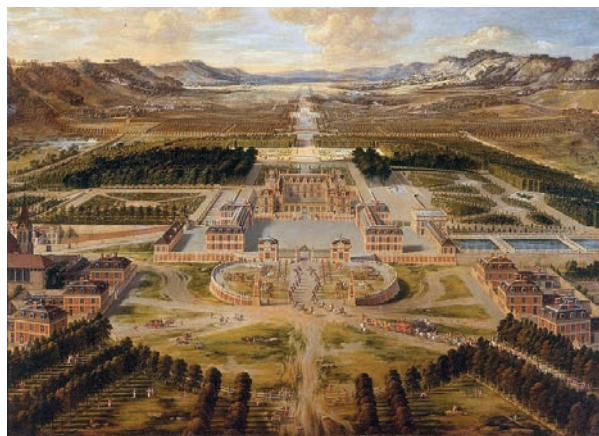
Reproduction du tableau de Pierre Patet, Le château de Versailles en 1668 .