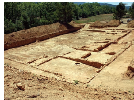
© Florian Troin (Ville de Draguignan)

Dans le bassin de la Nartuby, à Draguignan, les découvertes archéologiques passées et récentes permettent désormais de présenter une analyse plus fine du peuplement d'un territoire depuis la fin de l'âge du bronze jusqu'au début du Moyen Âge. Parmi les découvertes récentes, une fouille de sauvetage réalisée en 2022, boulevard Saint-Exupéry, sera plus particulièrement abordée. Elle a donné lieu à la découverte de structures datant des âges des métaux, puis pour la période romaine, d'une grande ferme viticole.